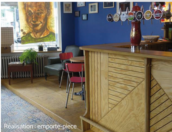
Réalisation : emporte-pièce

Für alle Anwendungen, bei welchen die besondere Ästhetik der Holzart wichtig ist und eine offene Rückseite ausreichend ist. Schreinerarbeiten, Innen-ausbau, DIY, Spielplätze, Mansardendächer, Holzrahmenbau, hochwertige Verpackungen.